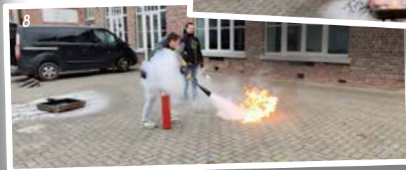
1,2 Seniorensport / 3,4 De Sint op bezoek / 5,6 Koesterweek / 7,8 Workshop brandveiligheid/